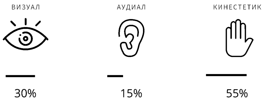
Рис. 3. Процесс выбора репрезентации информации